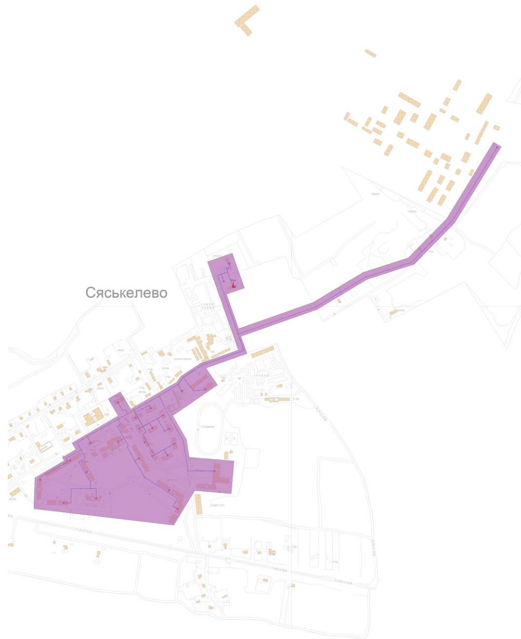
Рисунок 2.1. Зона действия котельной №36 д. Сяськелево