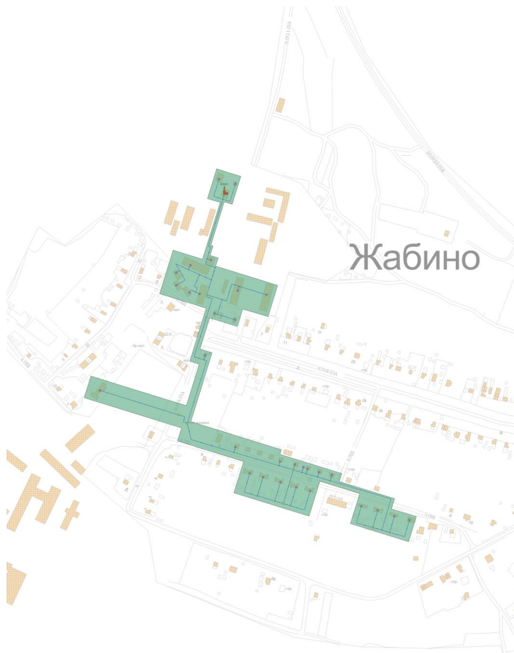
Рисунок 2.2. Зона действия котельной №52 д. Жабино